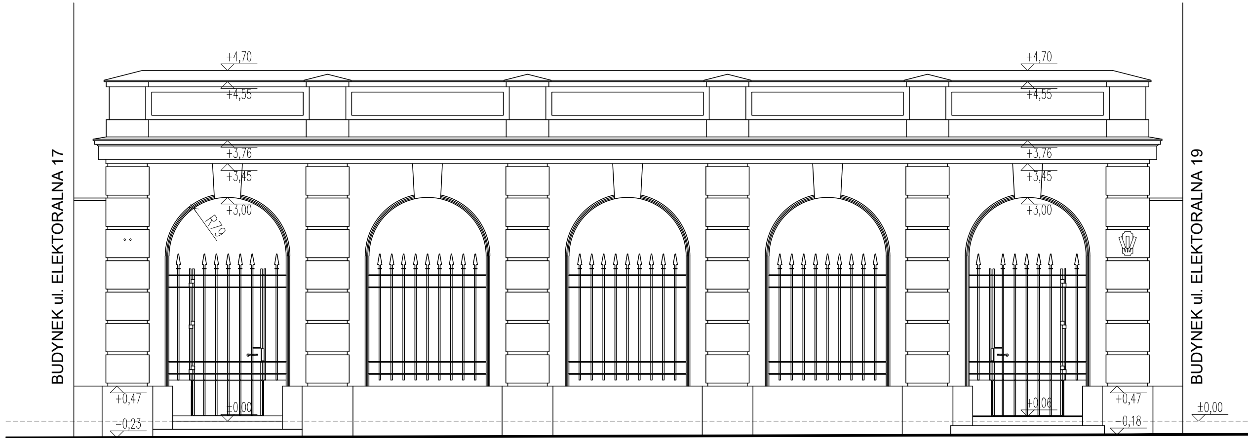
ELEWACJA PÓŁNOCNA (od ul. Elektoralnej) skala 1:50